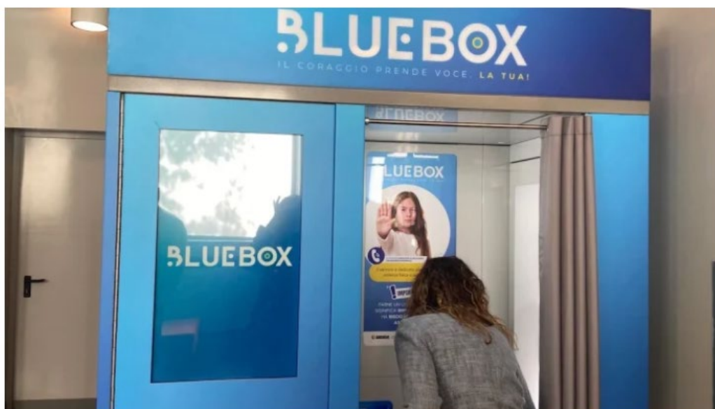
La cabina Blue Box, un aiuto alle vittime di bullismo

Il progetto Blue Box trasforma le cabine fotografiche in punti di primo contatto sicuri e anonimi per chi subisce abusi, grazie a una linea diretta con psicologi e operatori specializzati.