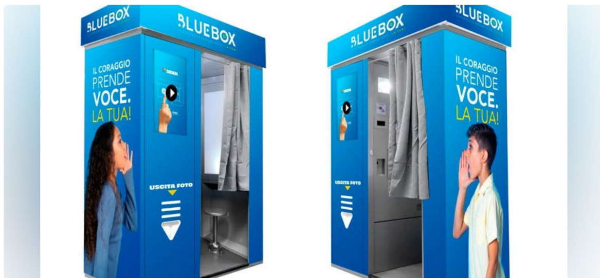
Blue Box: cabine Dedem per supporto anti-bullismo in Italia dal 2026

Contro il bullismo è disponibile una nuova iniziativa: prende vita Blue Box , il nuovo progetto nato dalla partnership tra Dedem S.p.A. , l'Osservatorio Nazionale sul Bullismo e sul Disagio Giovanile (ONBD) e la Fondazione Tellus, con l'expertise tecnico di DMP Electronics. L'obiettivo è offrire ai ragazzi vittime di bullismo e cyberbullismo e ai loro cari un luogo sicuro, discreto e facilmente accessibile da cui chiedere aiuto.