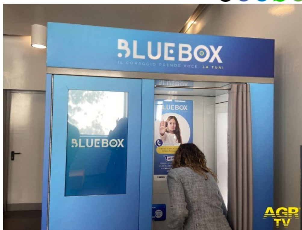
Blue Box box fototessera contro bullismo e cyberbullismo